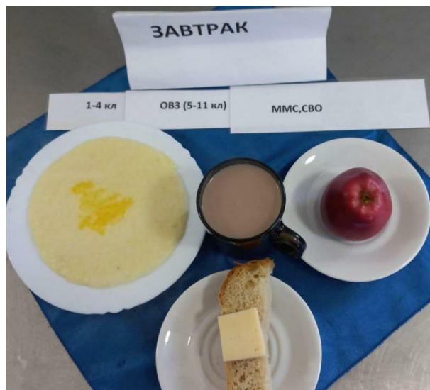
Завтрак для обучающихся, питающихся за счет родит.взноса(5-11 классы)